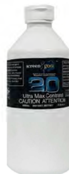
ウルトラマックス コントラスト 0.40 テーマパークコーティング ダークグレー