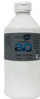
マックスコントラスト 0.70 ミディアムグレー