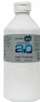
ハイコントラスト 0.85 ライトグレー