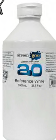
リファレンスホワイト 1.0