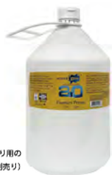
下塗り用の プライマー (別売り)